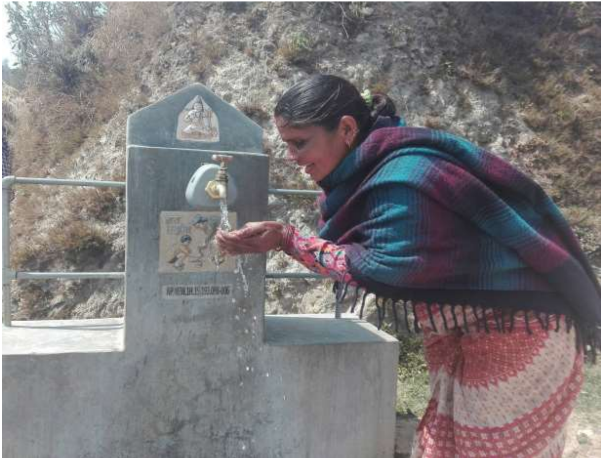
सेन्सर जडान गरिएको धारा ।

नेवाले अनुगमनलाई प्रभावकारी बनाउन वि.सं. २०७६ को बैशाखबाट सेन्सर मार्फत अनुगमन शुरु गरेको छ । यस अन्तर्गत नेपालको बागलुङ र सिन्धुली जिल्लाका पाँच सय भन्दा बढी धाराहरूमा सेन्सर जडान गरिएको छ । सेन्सर जिएसएम सिमयुक्त बैट्री र टरबाइन सहितको एउटा सानो यन्त्र हो, जसले नियमित रूपमा धाराबाट पानी बगेको वा नबगेको जानकारी दिनुका साथै कति मात्रामा पानी बगेको छ भन्ने जानकारी ड्यसबोर्डमा पठाउने गर्दछ ।